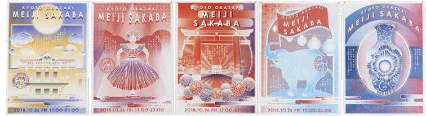
「京都岡崎明治酒場」ポスター(コロタイプ二色刷り) 電通クリエイティブ 2018年