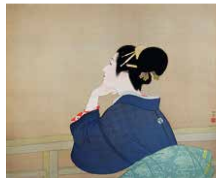
上村松園筆 待月 複製 (原本 足立美術館) 1979年