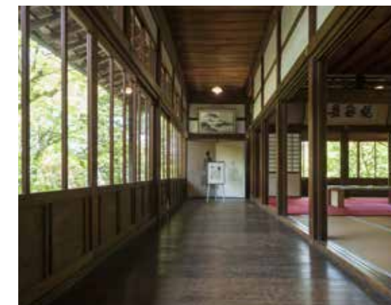
エスター・タイヒマン「On Sleeping and Drowning」展 無鄰菴 2019年