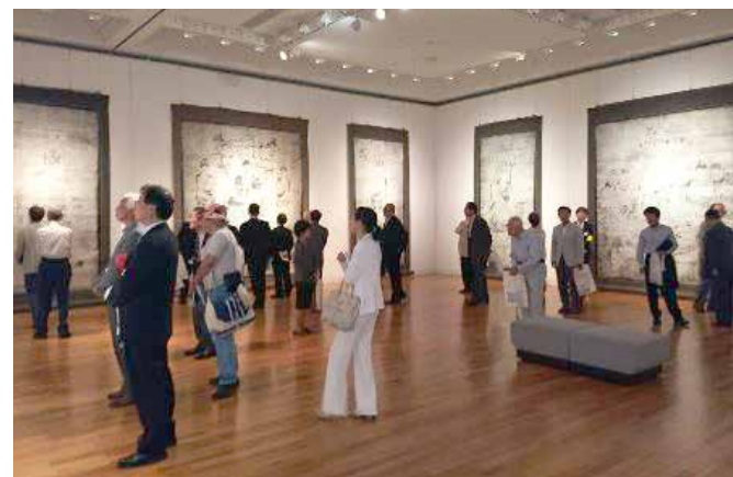
富山県高岡市美術館「美の記憶 よみがえる至宝たち」2016年9月16日～10月23日