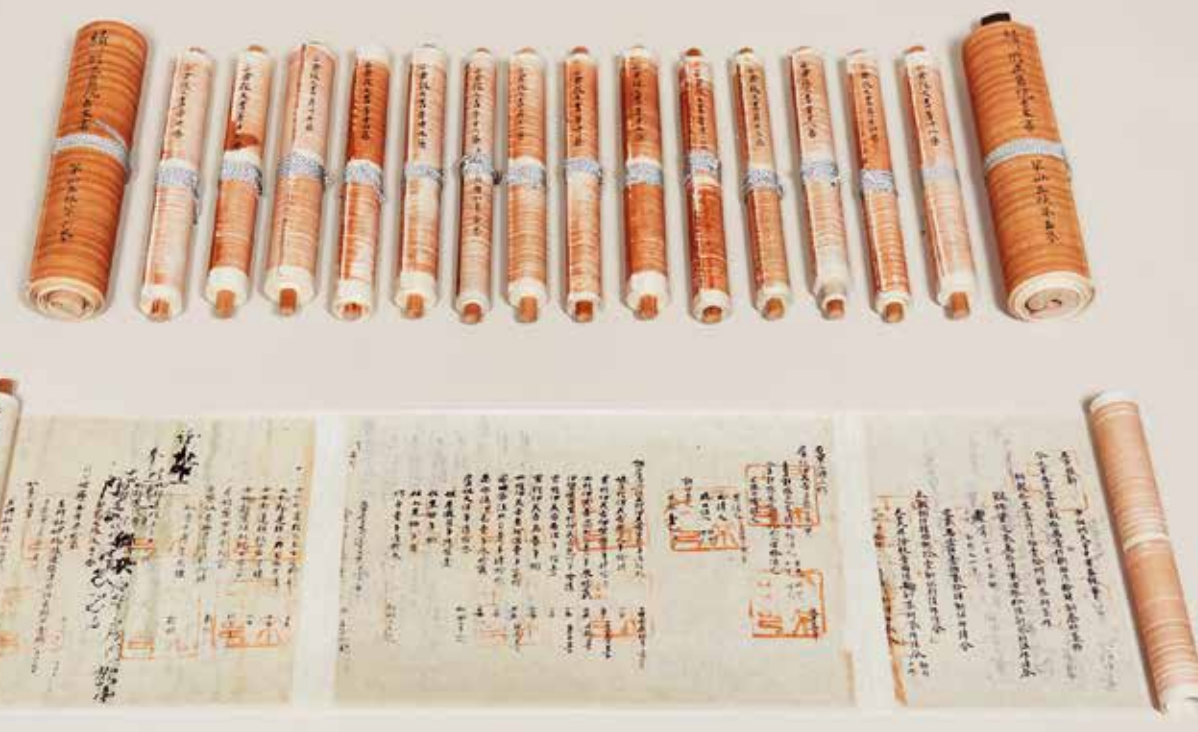
正倉院文書 複製 (原本 正倉院宝物) 国立歴史民俗博物館 1982年~現在

宮内庁書陵部には、代々皇室に伝わってきた貴重な古典籍や古文書類が所蔵されており、その数およそ39万点にもおよびます。この貴重な文化財を継承するために宮内庁が長年取り組んでいるのが古典籍の複製事業です。この事業の契機は、わが国の多くの文化財が灰燼に帰した1923(大正12)年の関東大震災でした。宮内庁の古典籍も近隣火災の類焼の危機に見舞われましたが、幸い無傷でのこりました。この災害を教訓とし、貴重な文化財の亡失を防ぎ、万一に備えるための複製事業が1931(昭和6)年より始まりました。この事業は、精巧な複製を制作し、それを各地で保管することによって危険分散するという目的のもと、現在も続いています。