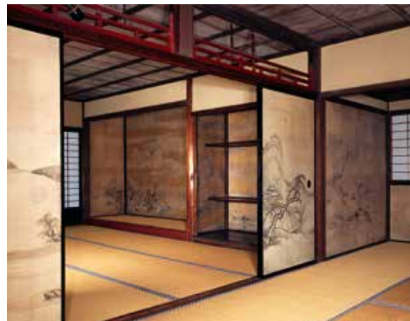
三溪園臨春閣 天楽の間・次の間 複製 1994年