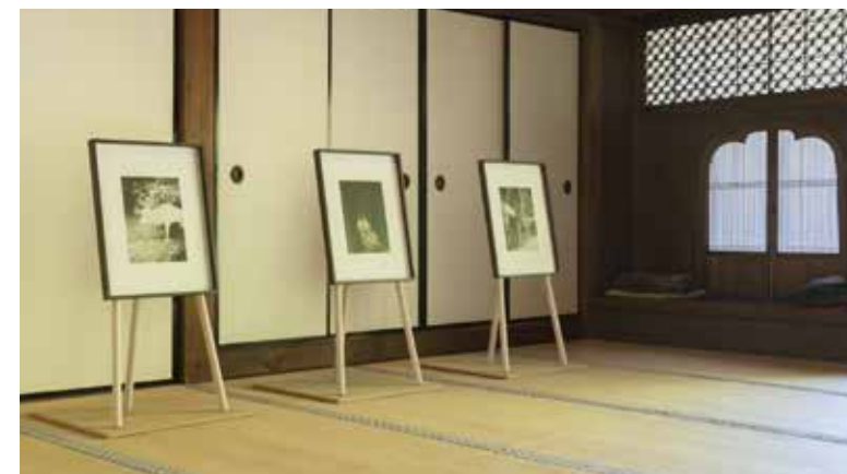
スティーブン・ギル「Night Procession」展 清水寺・成就院 2018年