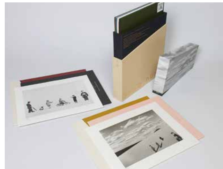
植田正治 《砂丘》 2017年