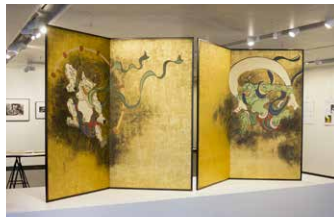
パリ日本文化会館「コロタイプによる琳派の美」(Japonismes2018参加企画) 2018年11月13日～12月1日