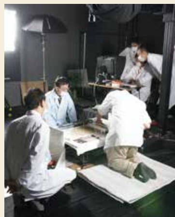
正倉院文書複製の撮影風景