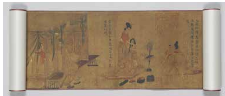
顧愷之筆 女史箴図巻 複製 (原本 大英博物館) 大英博物館 1966年