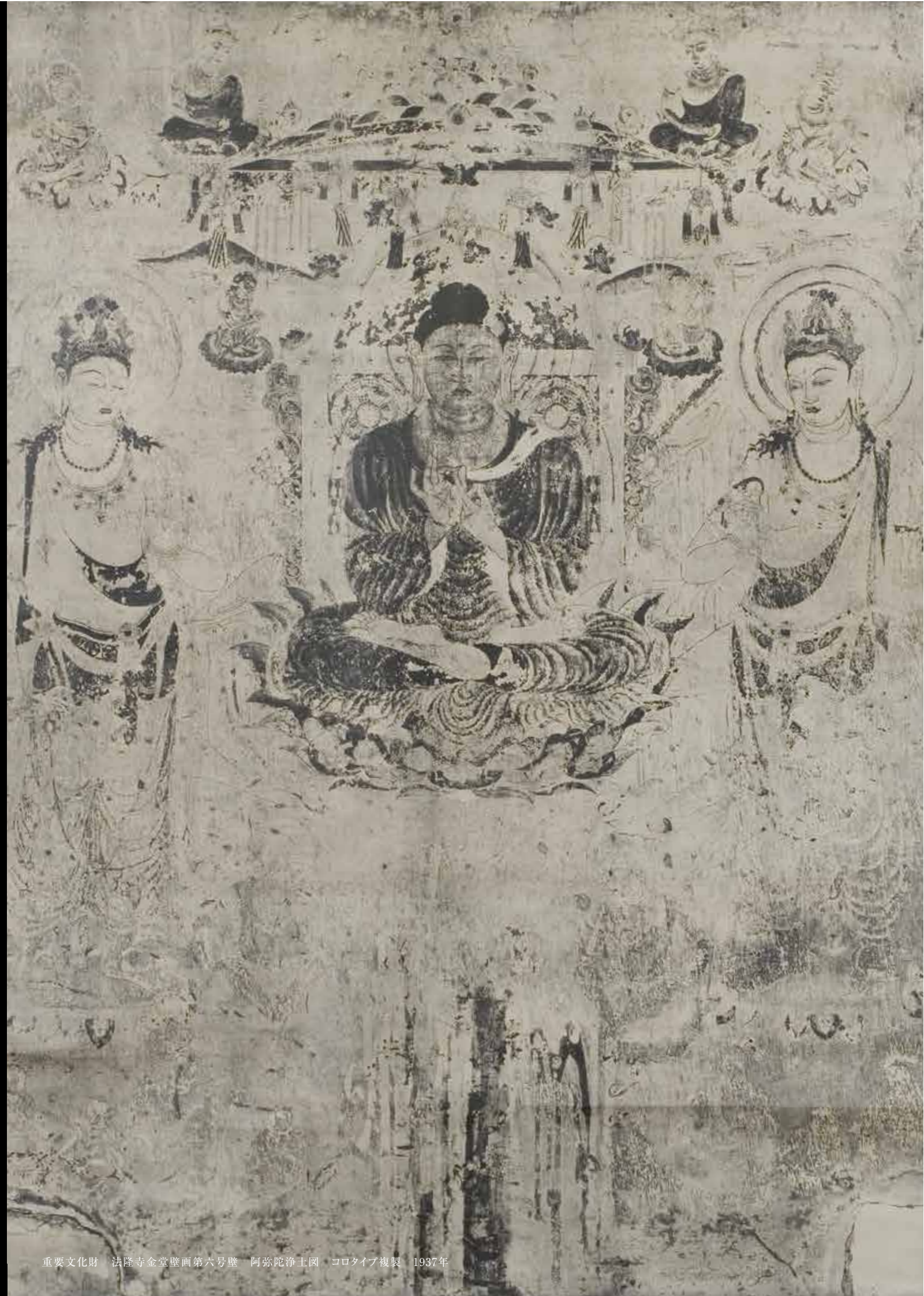
重要文化財 法隆寺金堂壁画第六号壁 阿弥陀浄土図 コロタイプ複製 1937年