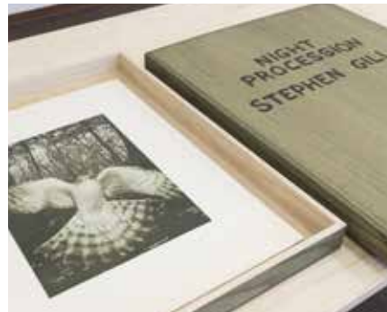
ステイブン・ギル 《Night Procession》 2017年