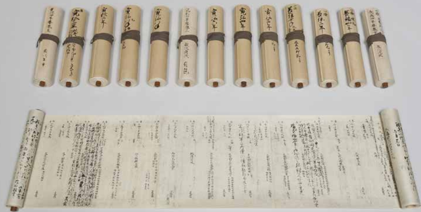
御堂関白記 複製 (原本 陽明文庫) 1936年

精巧な複製を制作するためには、まずその原本を非常に高い精度で正確に撮影することが要求されます。便利堂では、1905(明治38)年のコロタイプ工房開設に合わせ、文化財の撮影を専門とする写真技師を社内に配しました。以来、長きにわたり数々の重要な文化財や美術品の撮影を遂行してきました。便利堂の写真技師が対峙するものは特に繊細な配慮を必要とします。撮影時には美術品を扱うための専門知識が必要となるだけでなく、対峙物のもつ美に反応し写し出す心も持ち合わせなければなりません。