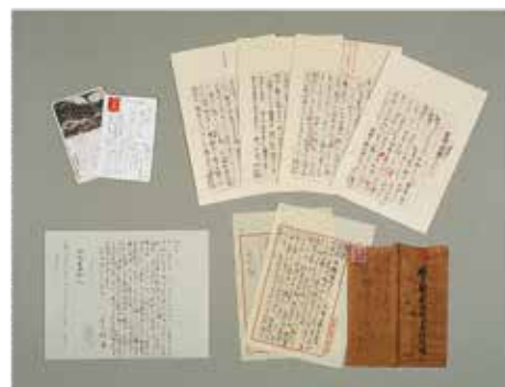
水野葉舟宛柳田邦男はがき他 複製 (原本 遠野市立博物館他) 遠野市立博物館 1982年