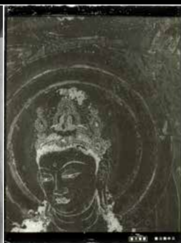
重要文化財 法隆寺金堂壁画原寸大分割ガラス乾板 法隆寺蔵