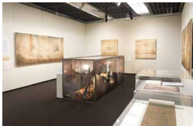
京都文化博物館「至宝をうつす ー文化財写真とコロタイプ複製のあゆみー」2017年12月16日～2018年1月28日