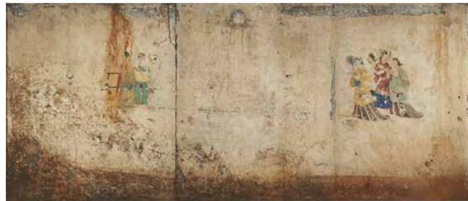
国宝 高松塚古墳壁画 複製 (原本 国・文部科学省所管) 2017年