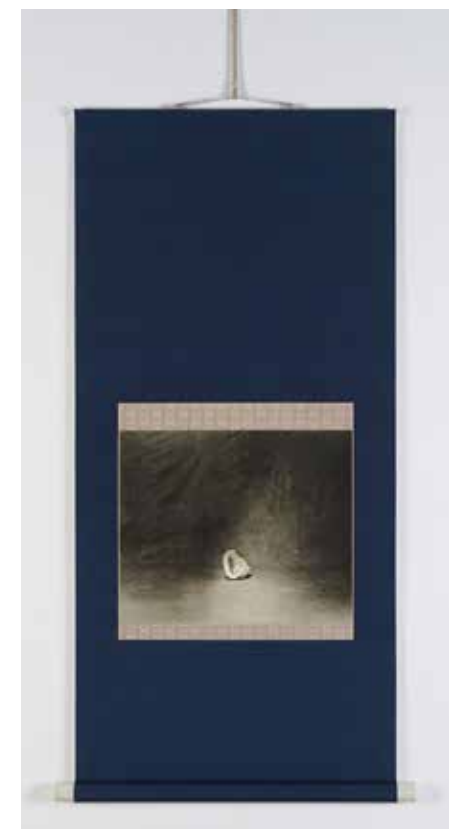
エスター・タイヒマン 《On Sleeping and Drowning》 2019年