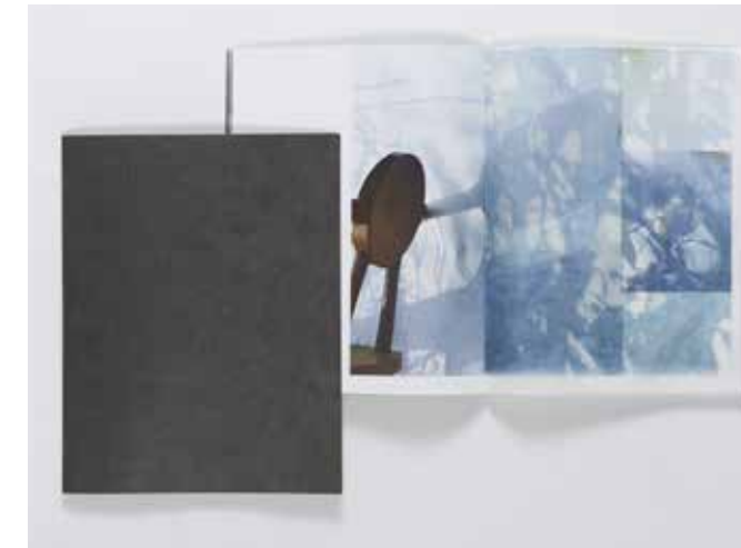
徳永家具工房 作品カタログ 2018年