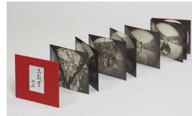
北京 三影堂 《設立10周年記念作品集》 2017年

アート作品だけでなく、グラフィック・デザインやプロダクツなどのさまざまなクリエイティブなモノづくりにコロタイプが持つ独自の味わいが採用されています。アイデアと創造力で従来にないモノづくりの可能性が広がります。