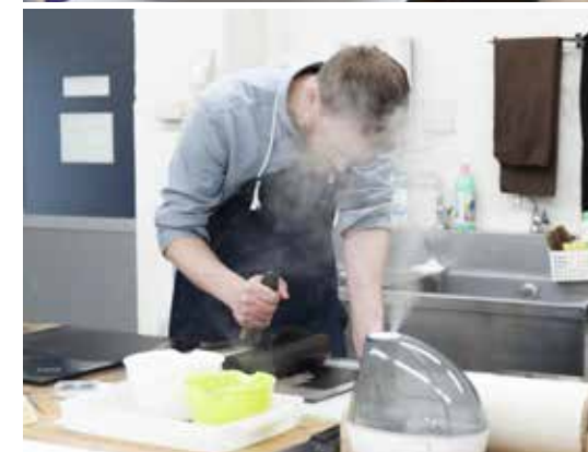
コロタイプアカデミーでの制作風景