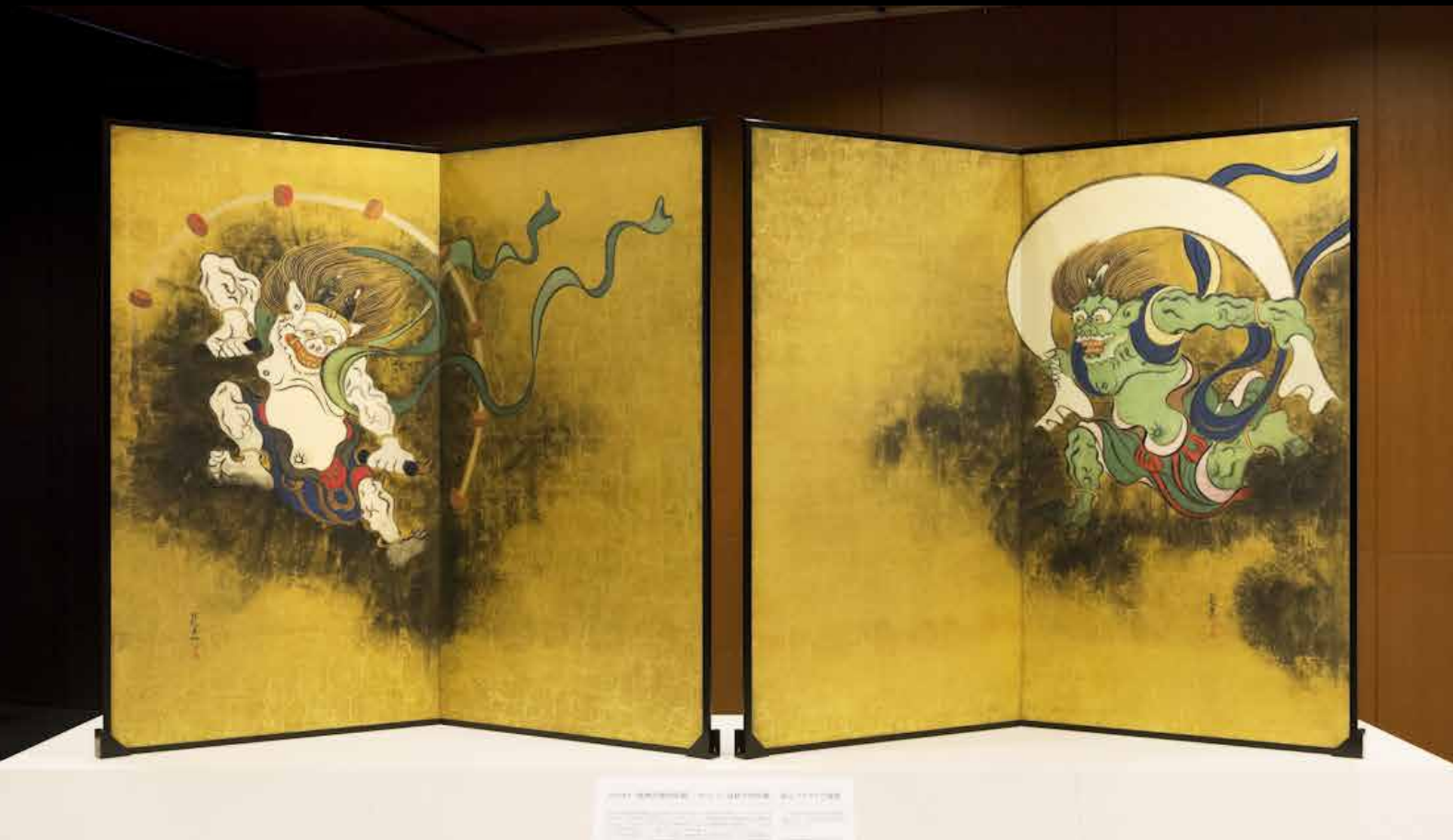
琳派400年記念「重要文化財 尾形光琳筆 風雷神神図・酒井抱一筆 夏秋草図(原本 東京国立博物館)」両面屏風 復元複製里帰り事業 2015年

平均60%の顔料を含む非褪色性に優れたコロタイプ専用インキを使用します。また、用紙には日本古来の伝統技法で漉かれた和紙を用います。