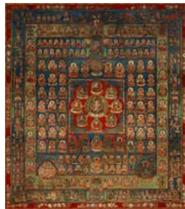
国宝 両界曼荼羅図(西院本)胎藏界複製 (原本 東寺) 香川県立ミュージアム 1999年