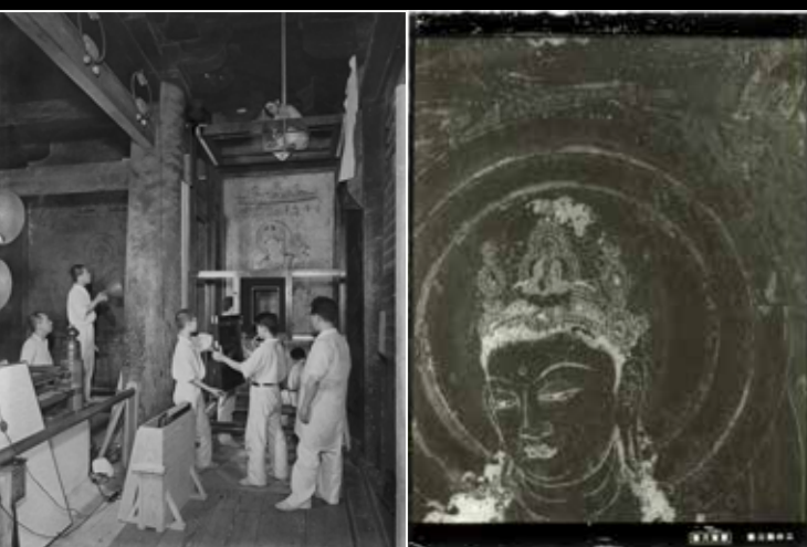
法隆寺金堂壁画撮影風景 1935年

1887(明治20)年に書店として創業した便利堂がコロタイプ工房を開設したのは、1905(明治38)年です。以来、文化財撮影と印刷物を通して文化財の保護や研究・普及に貢献してきました。これまで2500件を超える日本の文化財や美術品の複製制作を手掛けてきましたが、なかでもその象徴的な存在が法隆寺金堂壁画の複製事業です。国宝釈迦三尊像を囲む四方の壁に描かれた12面の壁画は、東洋の至宝と謳われ、その美術史的価値が高く評価されてきました。しかし1949(昭和24)年に不慮の火災に見舞われ、痛ましい姿となってしまいました。幸い1935(昭和10)年に便利堂によって、当時の写真技術の粋を集めたガラス乾板による精巧な写真撮影が行われており、1967(昭和42)年にこの写真原板を用いたコロタイプを下地とした「再現壁画」が完成し、往時の姿をよみがえらせることが出来ました。この唯一無二の写真原板は、2015(平成27)年に国の重要文化財に指定されています。