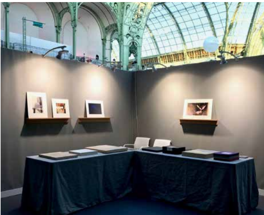
パリフォトでの出展の様子

世界でも希少になったコロタイプですが、もっとコロタイプを知っていただき楽しんでほしいとの思いから、様々な普及活動を行っています。各国アートフェアや見本市での出店、コロタイプ複製を用いた企画展の開催などを通して、その魅力を多くの方にご覧いただいています。また、一緒にコロタイプを楽しく学ぶための講座やワークショップも開催しています。