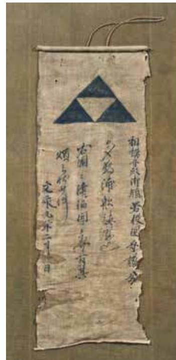
過所船旗 (原本 京都大学文学部博物館蔵) 神奈川県立博物館他 1991年