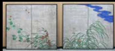
(夏秋草図屏風) 原本保存の為、現在は別々の屏風に 仕立てられている。