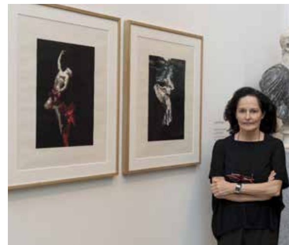
イザベラ・ムニョス コロタイプ作品展示 スペイン・ブラド美術館 2018年