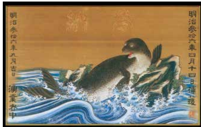
海獣絵馬 複製 (原本 五郎島八幡神社) 石川県立歴史博物館 2002年