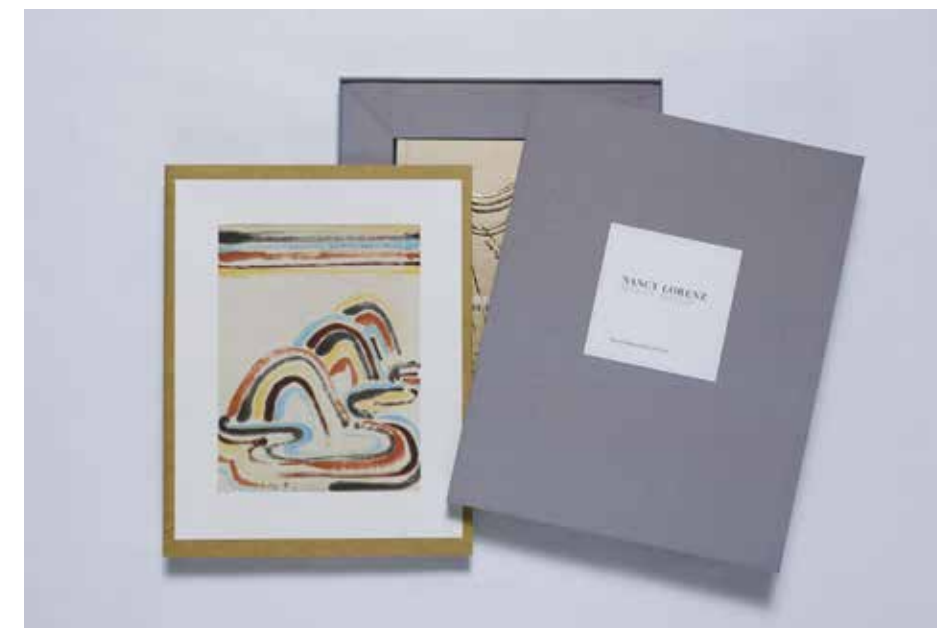
ナンシー・ロレンツ「MOON GOLD」展カタログ特装版(コロタイプ作品一葉付) サンディエゴ美術館 2018年