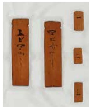
草戸千軒町遺跡出土木簡 複製 広島県立歴史博物館(原本とも) 1992年