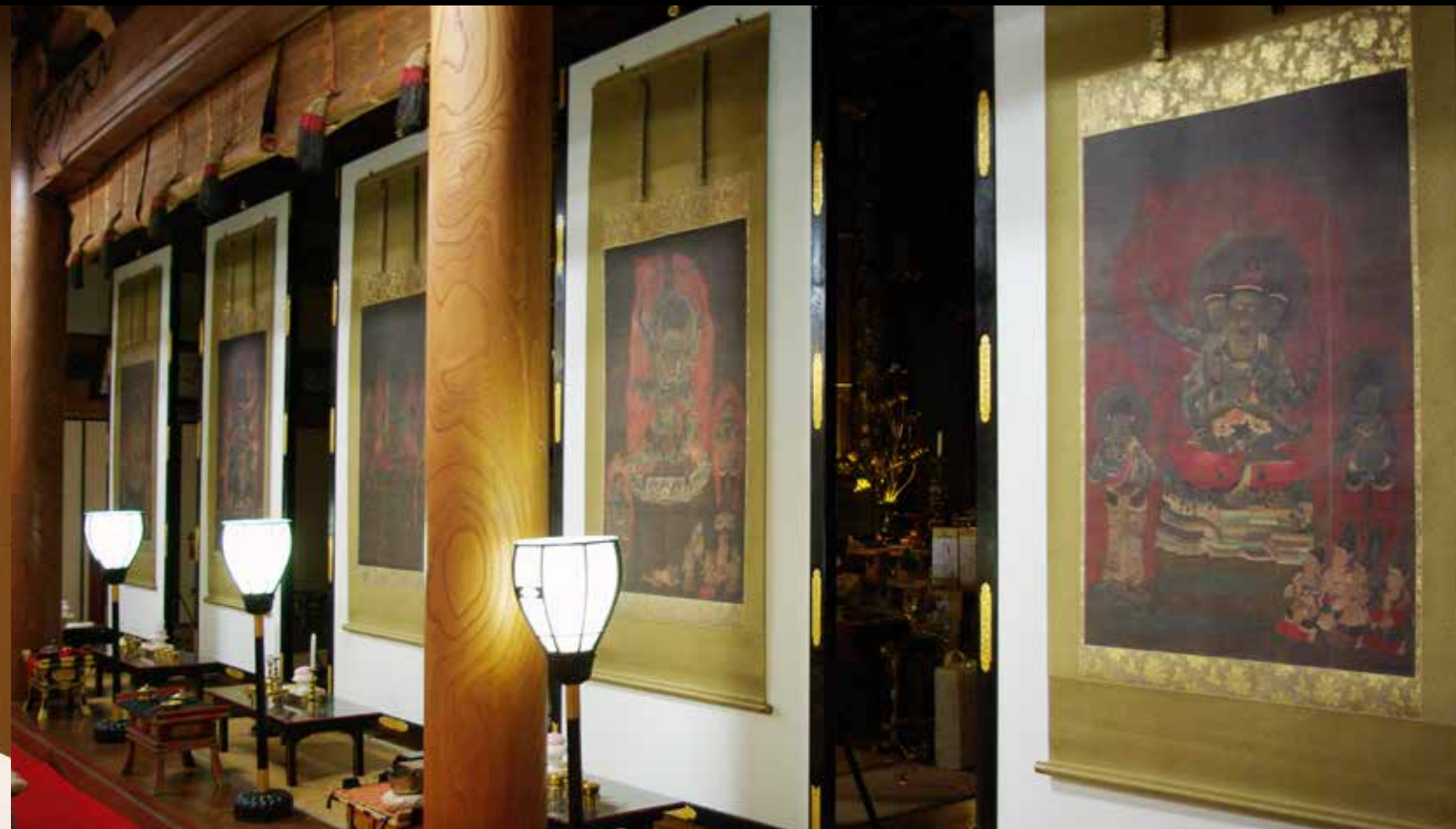
岐阜・来振寺「国宝 五大尊像」ご分身複製事業 2008年